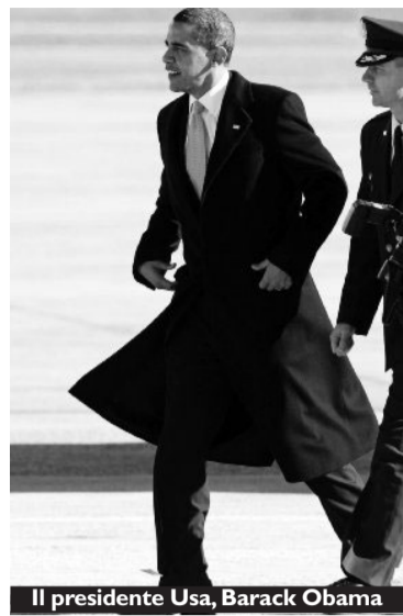
Il presidente Usa, Barack Obama